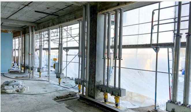
Die Alu-Schwerlaststütze TITAN SLS ermöglicht die exakte Einstellung der geforderten Vorspannung.