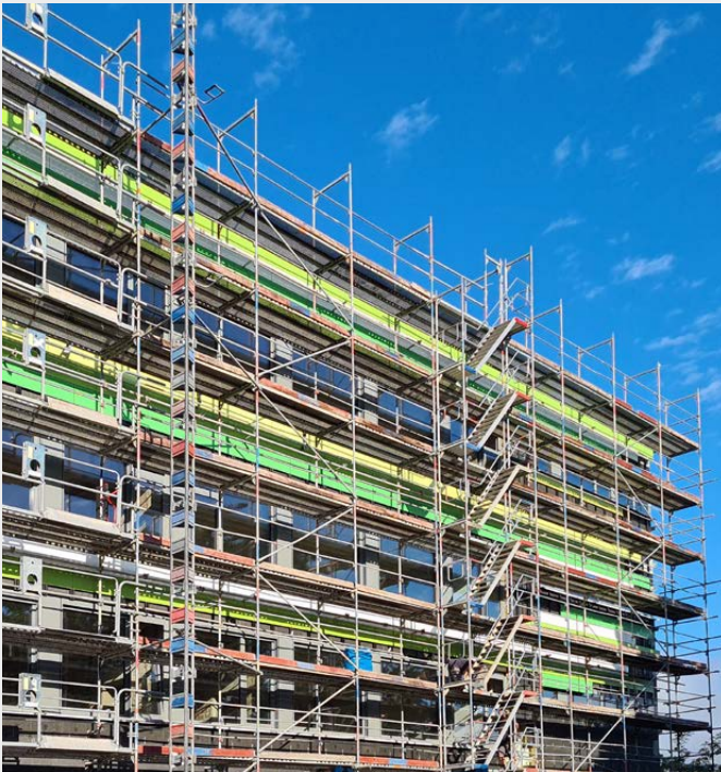
Bei den Fassaden-Sanierungen haben die Schwerlaststützen TITAN SLS die Randbereiche gesichert.