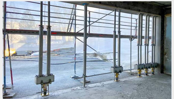
Per Handhebel am Hydraulikspindelheber lassen sich die Stützen anheben und absenken.